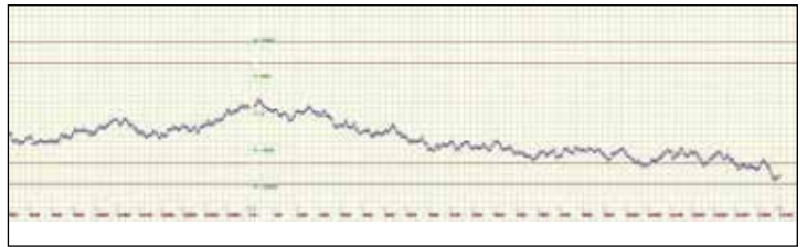
Abb. 4: ... und am 1. Juli 2015.

wohl Ereignisse, die viele Menschen bewegen, wie auch eine synchrone Informationsübertragung mittels einer Bündelung von Bewusstsein unterstützt durch quantenphysikalische Prozesse führen zu einer Veränderung der Kurve im Rahmen des GCP. Laut Dr. Nelson sind weniger die Einzelkorrelationen für sich allein aussagekräftig. Erst bei der Berücksichtigung großer Datenmengen kann mit Sicherheit eine Abweichung vom Zufall behauptet werden: „Die Statistik wird nur durch Wiederholung verbessert ... Nur durch viele Wiederholungen lassen sich (...) Fehler ausmitteln und das Nutzsignal verstärken, wenn denn eines da ist.“ 5