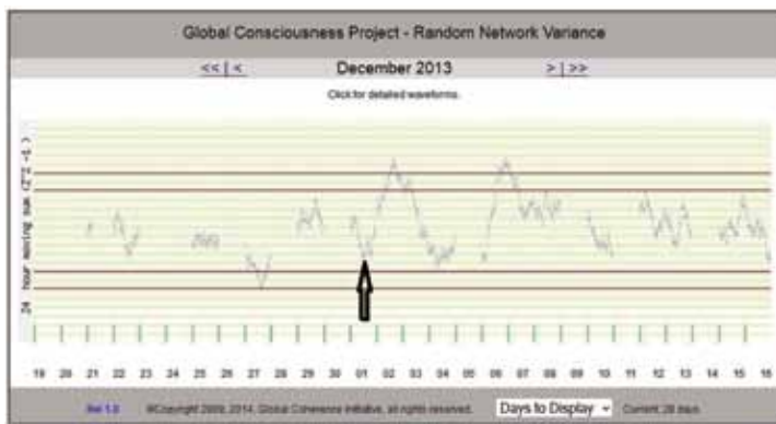
Abb. 1: Messung vom Dezember 2013 - der Pfeil zeigt einen deutlichen Anstieg der GCP-Kurve am 1. Dezember. Genau zu diesem Zeitpunkt haben mehr als 200 TimeWaver-Anwender einen positiven Impuls gesetzt.